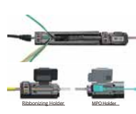
Kit de ribbonizer